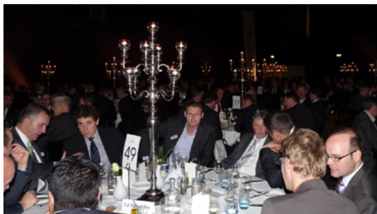
Het diner aansluitend aan de Jaarlijkse Algemene Ledenvergadering op 29 november 2012