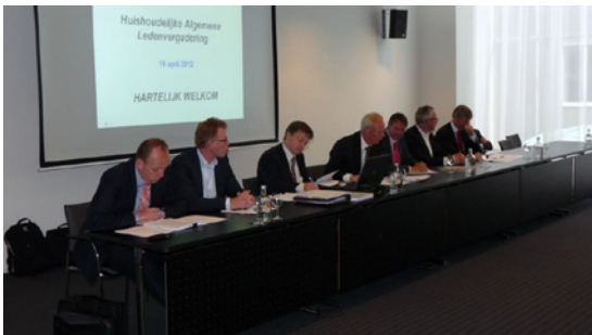
Het bestuur tijdens de Huishoudelijke Algemene ledenvergadering op 16 april 2012