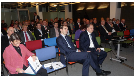
De aanwezigen tijdens de lezingen op de Jaarlijkse Algemene Ledenvergadering op 29 november 2012

Na afloop van de lezingen werden de aanwezigen uitgenodigd voor een aperitief in de Shipping Hall. Het diner vond vervolgens plaats in een zeer sfeervol gedecoreerde Rotterdam Hall en werd bijgewoond door ruim 520 personen. Ter afsluiting van het diner was er weer het inmiddels wel traditioneel te noemen dessertbuffet dat goed in de smaak viel.