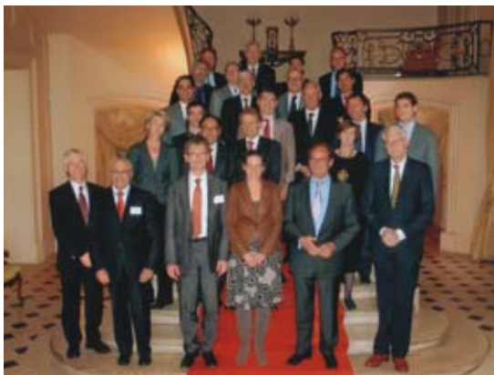
De Frans – Nederlandse expert groep met betrekking tot graanmarkten op 29 maart te Parijs.

Coceral hield in het voorjaar haar Assemblee in Genève met een mini symposium dat het thema droeg: 'The Financial markets reform; impact on the Agricultural World'.