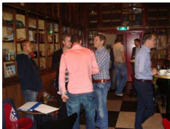
De examinanten en oud cursisten van de graancursus

aangegaan voor aanpassing van de lesstof. Tevens werden workshops en nieuwe vakken als duurzaamheid en contactuele analyse aan het programma toegevoegd. Deze CANON vormt een leidraad voor de cursus in de toekomst. Volgend jaar zal de cursus deels ook overdag worden georganiseerd.