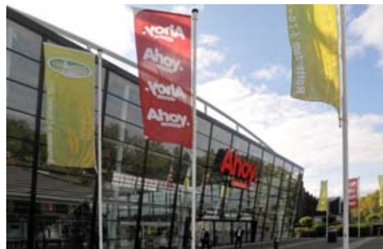
De Europese Warenbeurs in Ahoy Rotterdam.