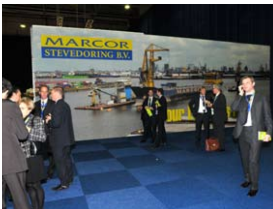
Bij de ingang de blikvanger van Marcor