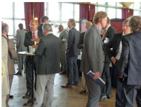
De beursdag op 11 april in het Zalmhuis te Rotterdam.