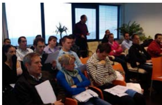
Excursie en les van de graancursus bij TLR te Rotterdam