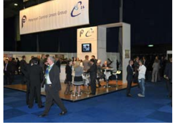
Een hoofdsponsor stand van Peterson Control Union Group