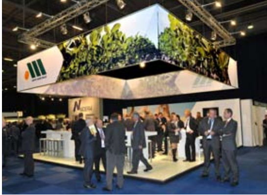
Een groot opgebouwde stand van Amaggi