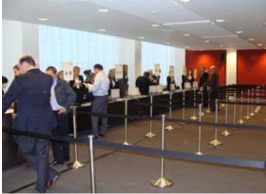
De voor-registratie in het World Trade Centre