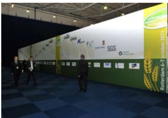
The Wall of Fame, een welkom door leden van Het Comité en hoofdsponsors aan de bezoekers van ECE-Rotterdam 2011