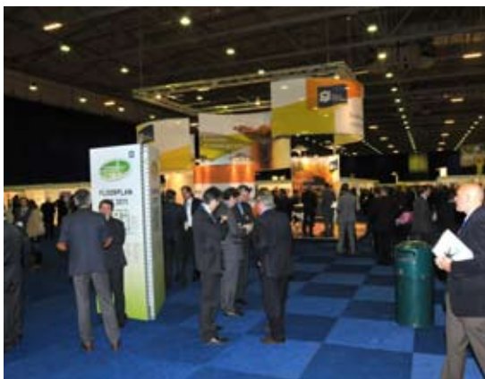
Voorin Hal 1 de stand van Port of Rotterdam