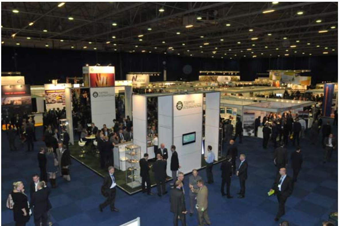
Overzicht van hal 1 in Ahoy.