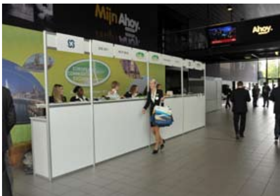
De info balie bij de ingang van Hal 1 waar de beurs plaats zou vinden.