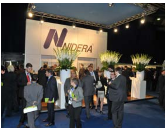
Eén van de hoofdsponsors, de stand van Nidera