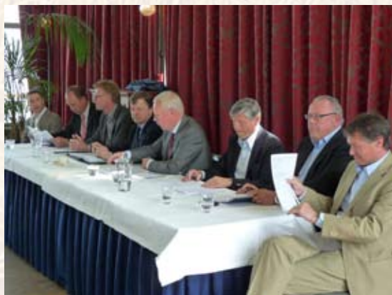
Het Bestuur en de Secretaris tijdens de Huishoudelijke Algemene Ledenvergadering

Het Comité hield de extra HAL ten kantore van Het Comité aan de Heer Bokelweg 157b te Rotterdam op 29 juni. Deze extra HAL was noodzakelijk in verband met de uitgestelde goedkeuring van het financieel jaarverslag. Er was besloten een gedeeltelijke voorziening op te nemen met betrekking tot de rekening courant en achtergestelde lening met LabCo.