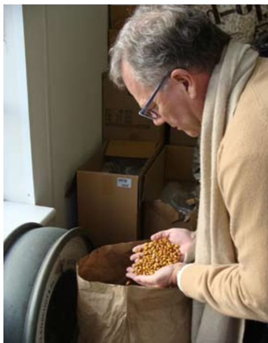
Beoordeling bruine bonen van de oogst 2011 te Zevenbergen

Er vond een korte bijeenkomst plaats met de leden van de Colleges voor het opmaken van de standaardmonsters, gecombineerd met de vergadering van de Werkgroep Menselijke Consumptie en Handel.